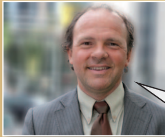
Philippe Muylers Vlaams minister van Financiën en Begroting

“Het Dexia-dossier hangt dit land als een molensteen om de hals. Als het verder fout gaat, stijgt de Belgische staatsschuld gigantisch. Ik vind dit gewoon hallucinant. De onbeantwoorde vragen stapelen zich ondertussen op. Maar Di Rupo zag geen beletsel om de Dexia-bestuurders kwijting te verlenen. Enkel het duidelijke ‘neen’ van de Vlaamse Regering deed de Belgische stem nog naar een ‘onthouding’ schuiven. Niet te begrijpen.”