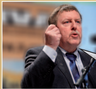
Siegfried Bracke N-VA-Kamerlid

“Ik stel keer op keer vast dat het onderscheid tussen CD&V, Open Vld en sp.a gewoon verdwijnt. Het zijn drie partijen die samen - en warmpjes - in het apparaat zitten. Kijk naar het debat over de gas- en elektriciteitsprijzen. Plots roept men energienetbeheerder Eandis uit tot vijand nummer 1. Laat me niet lachen. Wie bestuurt Eandis? Dat zijn 8 CD&V'ers, 4 sp.a'ers en 4 Open Vld'ers. Ook in die zin is de N-VA vandaag dé uitdager van het systeem.”