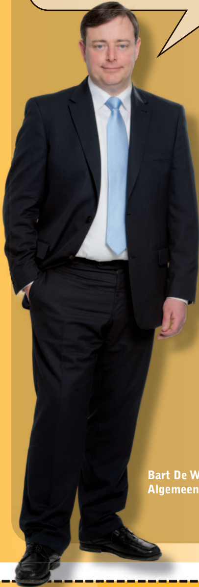
Bart De Wever Algemeen voorzitter N-VA

De N-VA kiest resoluut voor verandering. En ik vraag ook u om, samen met ons, die keuze te maken. Wil u de regering-Di Rupo weg, stem dan op 14 oktober op de N-VA!