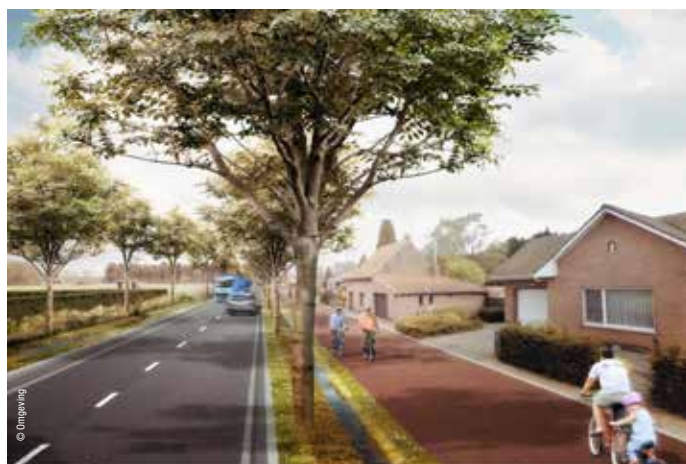
▲ CDE-Vlim.be ziet af van haar verkiezingsbelofte om een parallelweg aan te leggen en neemt de plannen van de N-VA voor de Nieuwe Dreef dan toch over.

Dat is eigen aan de politiek en is dan ook geen excuus om inwoners voor te liegen. Wij blijven u altijd vertellen waar het op staat. We betreuren dat u van CDE-Vlim.be niet hetzelfde mag verwachten.