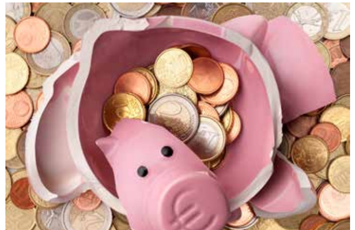
▲ Bereid u voor op een tsunami van belastingen.

N-VA Beerse-Vlimmeren wenst u dan ook veel sterkte toe de komende jaren. Tegelijk blijven wij niet bij de pakken zitten. Wij strijden voor een gemeente die financieel gezond is en waar het voor iedereen goed is om te werken en te wonen.