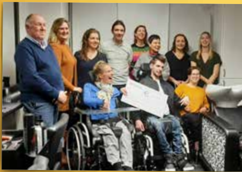
▲ N-VA Beerse-Vlimmeren tapte tijdens de kerstmarkten drie dagen voor het goede doel. We schonken zo'n 400 euro aan Het Vierkant Wieltje uit Beerse.

Elke gemeenteraad opnieuw doen onze raadsleden er alles aan om uw belangen te verdedigen. In december duurde de gemeenteraad maar liefst tot 1 uur 's nachts. ▼