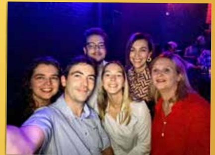
▲ Samen met het gemeentepersoneel zetten onze raadsleden het nieuwe jaar feestelijk in.