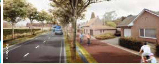
N-VA-plan voor Nieuwe Dreef haalt het dan toch (p. 4)