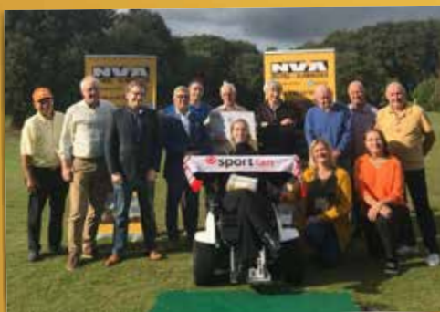
◀ Tijdens de Worstenfeesten in Vlimmeren zette onze afdeling zich in voor een lokaal goed doel. We voegden de opbrengst samen met wat we inzamelden op onze jaarlijkse barbecue en konden zo een mooi bedrag van 780 euro schenken aan G-Golf Beerse.