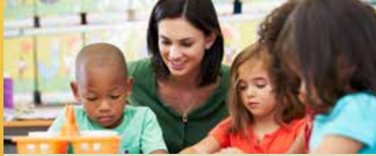
Kinderopvang wordt duurder (p. 2-3)