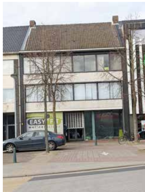
▲ Dit is Kerkplein 7, waar de meerderheid een pand wil huren.

Voor de N-VA is de situatie glashelder: we kunnen dat geld beter gebruiken om tot een definitieve oplossing te komen.