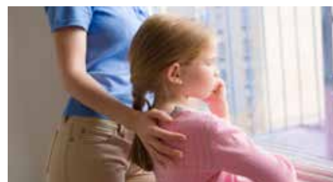
▲ Kinderarmoede tegengaan is een moeilijke opdracht, maar het blijft een topprioriteit voor ons OCMW-bestuur.

Via werkgroepen kan men doelgericht werken aan oplossingen op maat voor elk kind en acties plannen op lange termijn. Onze beleidsmedewerker