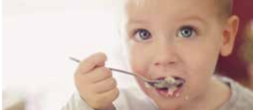
Beerse strijdt tegen armoede p.2