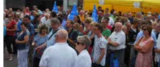
Zomerdrink van de burgemeester p.3