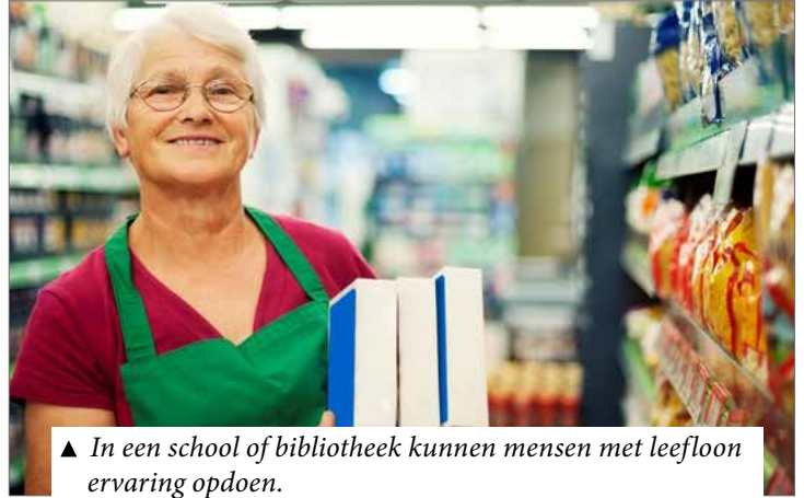
▲ In een school of bibliotheek kunnen mensen met leefloon ervaring opdoen.

Beerse zet dus meer dan ooit in op werkbegeleiding. “We zien dat de mensen die via artikel 60 aan de slag zijn goed werk leveren”, verklaart Smans. “En nog belangrijker is dat ze, door de ervaring die ze zo opdoen, verder kunnen doorstromen richting de arbeidsmarkt.”