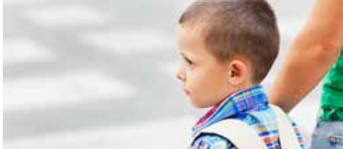
Veilige zebrapaden in Vlimmeren p.2