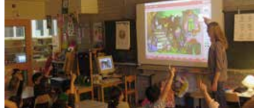
Gemeente zet in op digitale schoolborden p.2