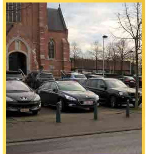
De parking op het kerkplein moet blijven.

We gaan verder met de afbouw van onze gemeentelijke schulden en we blijven verder investeren in onze gemeente en onze toekomst. Met N-VA aan het stuur daalden de belastingen voor het eerst in jaren. Een gezond budget is belangrijk voor onze kinderen en kleinkinderen, zo voorkomen we dat zij de rekening gepresenteerd krijgen.