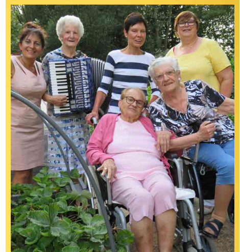
We blijven investeren in onze senioren.

Mantelzorgers ondersteunen we door het voorzien van dagopvang en eventueel nachtopvang in een CADO (Collectieve Autonome Dagopvang).