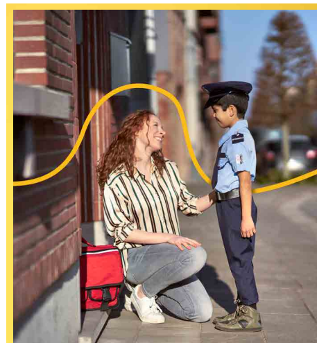
Uw veiligheid is onze prioriteit.

De wijkagent moet meer te zien zijn in het straatbeeld, we willen meer blauw op straat . De dorpscentra en wijken moeten bovendien veiliger worden voor zwakke weggebruikers.