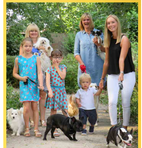
We maken van dierenwelzijn een prioriteit!

We pakken actief alle soorten ongedierte aan (bijvoorbeeld: ratten). De gemeente zal op de publieke grond actief optreden. Ook burgers met ongedierte op hun privéterrein zullen dit verplicht moeten bestrijden.