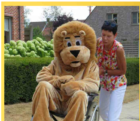
De kwaliteit van onze voetpaden moet beter.