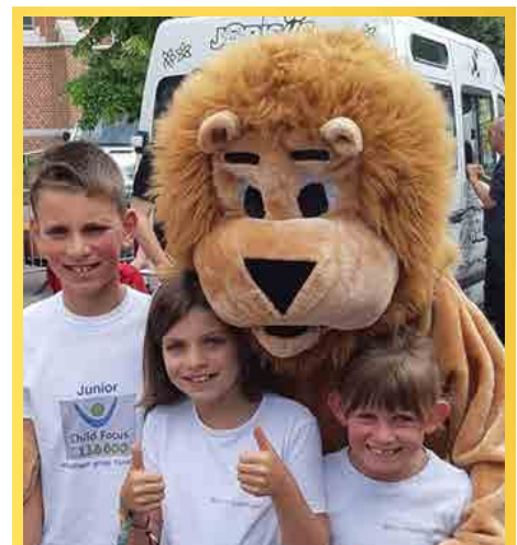
Iedereen moet thuis zijn in onze gemeente.

We voorzien een sterrenweide voor sterrenkindjes op ons kerkhof.