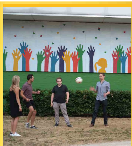
We investeren in sport en gezondheid