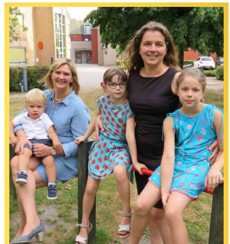
Onze jeugd krijgt de nodige aandacht.

Onze speelpleintjes moeten voldoende aandacht krijgen en steeds goed onderhouden worden. We voorzien extra budget voor infrastructuurwerken voor onze jeugd.